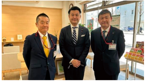
博多駅前四郵便局視察(福岡市)

福岡市と宮古島市の郵便局を表敬訪問しました。デジタル化に伴う業務変更、マンパワー不足などの実情を伺いました。郵便局は地域コミュニティの支え役、よろず相談窓口としての役割も果たしており