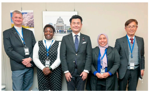
国際環境 NGO と懇談 (国会内)

ます。お聴きした課題、ご要望を真摯に受け止め、今後の政策立案に活かしてまいります。