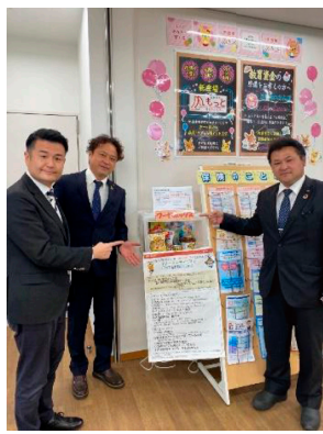
狩俣市議 富浜市議と宮古島郵便局視察

福岡市と宮古島市の郵便局を表敬訪問しました。デジタル化に伴う業務変更、マンパワー不足などの実情を伺いました。郵便局は地域コミュニティの支え役、よろず相談窓口としての役割も果たしており