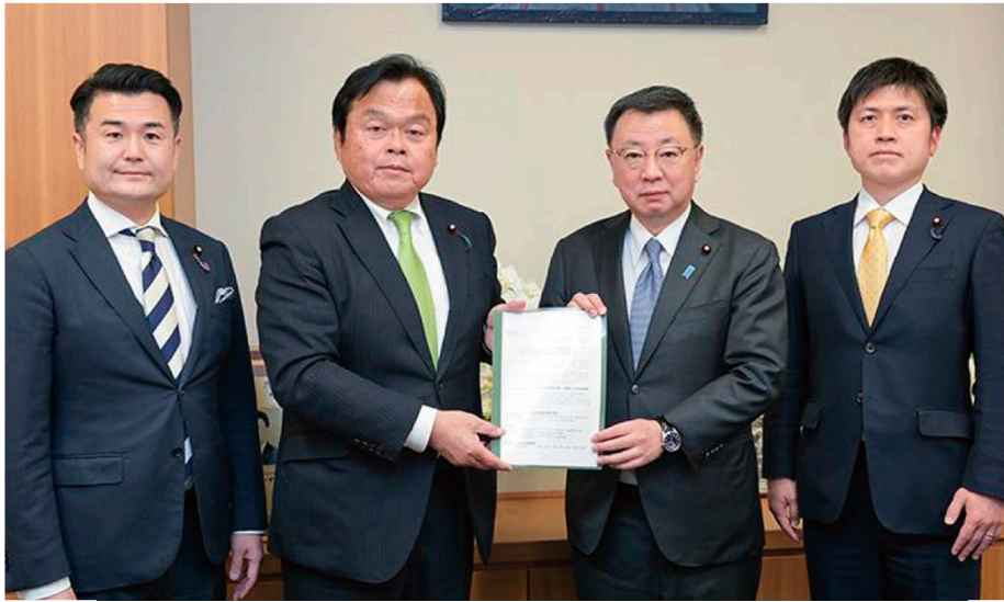
松野官房長官にエネルギー政策緊急提言を手渡す