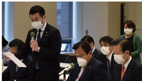
観光立国推進議員懇話会

私が幹事長を務める党観光立国推進議員懇話会の設立総会を開催。観光関連団体の皆様幅広くご参集いただき、コロナ対策やデジタル化支援、GOTOキャンペーンの