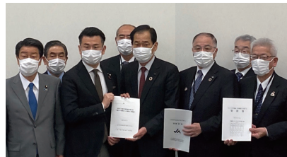
団体の皆様よりご要望を受ける

また、JA全中、畜産・酪農団体の皆様よりご要望を承り、乳製品の在庫対策、輸入飼料