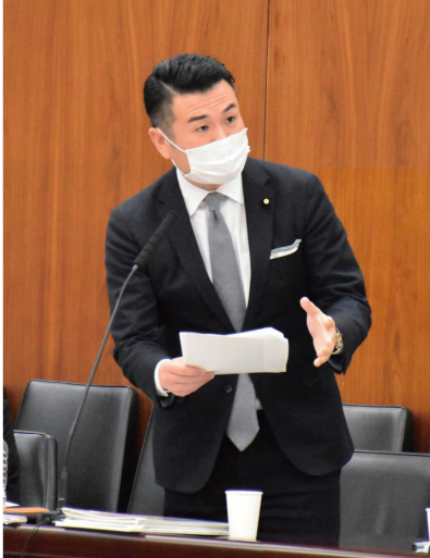
参議院経済産業委員会で質問