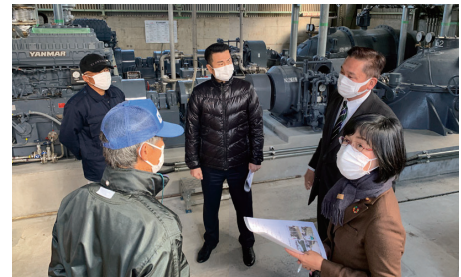
佐賀県鳥栖市内で視察

佐賀県鳥栖市下野地区にて、八月の豪雨で冠水した排水機場を視察。排水ポンプが完全に浸かり現在は使用不能に。近年大規模水害が頻発しており、梅雨の時期を迎える前に早急な対策をうつ必要があります。国県市のネットワークで、ご安心いただけるよう尽力してまいります。