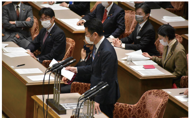
参議院議院運営委員会で大臣に質問

参議院議院運営委員会の理事、党国会対策筆頭副委員長を拝命し、先の国会では、未来応援給付をはじめとしたコロナ対策を盛り込んだ補正予算及び来年度予算編成・税制改正の早期成立を目指す