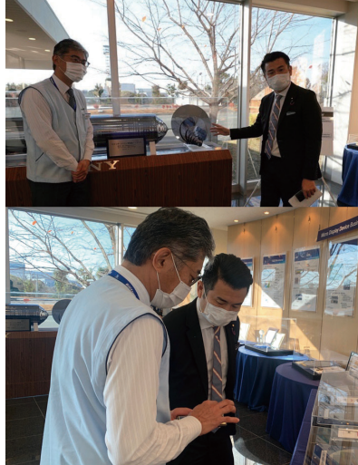
熊本半導体工場を視察

現在、世界的な半導体不足で各国の製造業に多大な影響が出ており、国内サプライチェーンの確立は