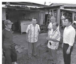
被災農家を見舞う

要望を聞くとともに、被害現場を視察しました。大田町長は農水産業の被害額が6781万円に上ると述べ、「まだ増えることが想定さ