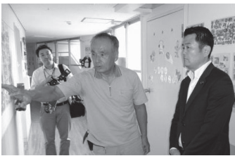
施設長から話を聞く

福岡市内にある「福岡子供の家みずほ乳児院」を訪れ、虐待や家族の病気などで、家族と暮らせない子どもへの支援策をはじめ、施設経営の課題などについて、関係者と意見を交わしました。同院は、職員が