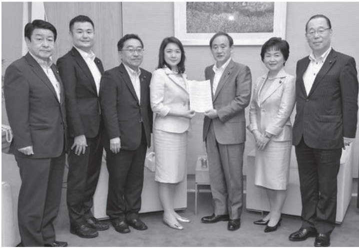
菅官房長官に申入れを行う党PTの河野事務局長ら

もあります（国内米の生産量は年間799万トン）。私が事務局長を務める公明党食品ロス