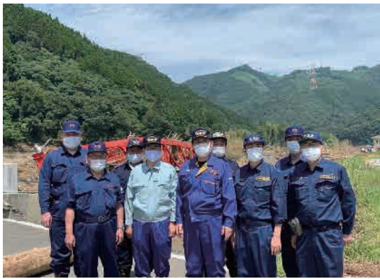
氾濫した球磨川を視察

識調査を行う」と述べました。ボランティアの受け入れ体制や仮設住宅の設置など、被災者支援に全力を尽くしてまいります。