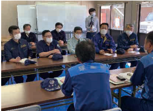
球磨川町長から要望を聞く